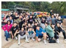
• 學生透過多天的活動，增進彼此友誼

全體中二學生一同參與4日3夜的歷奇訓練營，在導師的帶領下，一同參與各式各樣的歷奇挑戰，學習合作與解難，訓練其團隊感及領袖才能。