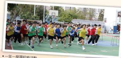
● 一年一度環校跑活動