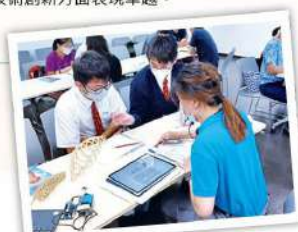
• 學生參賽時向專家請教

本校的 STEAM 教育團隊中，部分成員具備工程師和博士的專業背景，確保教學質量。