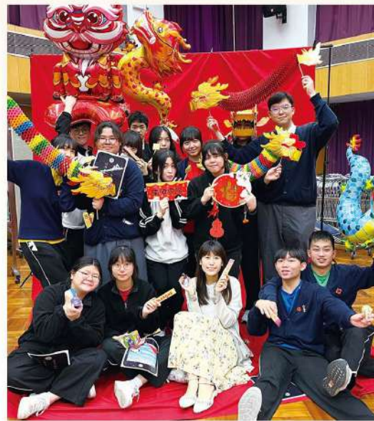
● 震夏年青迎新歲，師生同樂，歡慶佳節

為學生個別支援，由本校兩名駐校社工及三名輔導員負責，並由教育心理學家及學生支援統籌主任督導，運用 360° 全方位學生支援計劃協助學生正向成長，包括為學生之社交、情緒及學習情況作出支援，並為個別學生設計個別學習計劃。