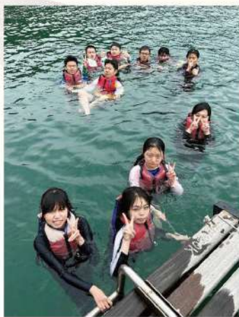
• 透過營中各種挑戰，學生更了解自我，發掘潛能

學校每年與外展訓練學校合作，舉辦五日四夜外展訓練活動，對象為中四級學生。透過外展活動，學生可培養溝通、合作、領導等技能，增強團隊凝聚力，提升個人品德素質。