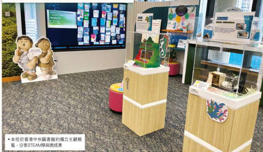
• 本校於香港中央圖書館的獨立主題展覽，分享STEAM學與教成果