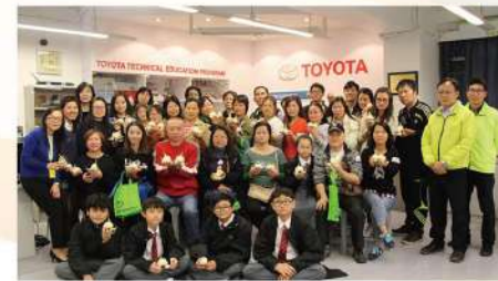
● 家教會水仙花開迎新春活動，促進家校合作

為家長支援，本校一直重視家校合作，教育心理學家及輔導員會定期與家長進行面談，以交流教養學童的心得，並按需要為家長及學生作出轉介服務。學校除定期舉行家長輔導小組及正向親子活動，增加家長間及家庭間的互動交流，亦會與外間專業機構協作，開設正向家長研習班，進一步加強家校合作之果效。