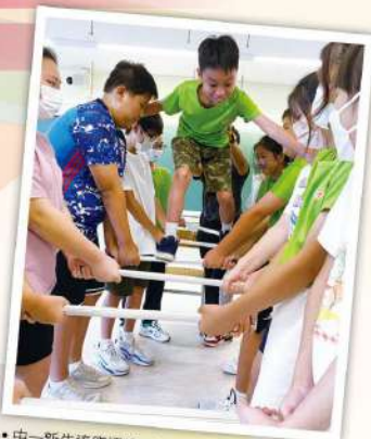
● 中一新生適應課程，歷奇體驗，團結一致

全校老師均具「精神健康急救證書」資格，獲資格之老師能辨識學生的精神健康問題並適時展開介入工作。