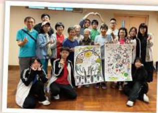
● 「元朗震夏長者學苑」大集繪活動，長青共學共樂共成長