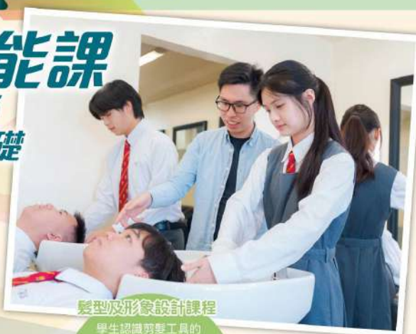
髮型及形象設計課程

本校幫助學生認識自己在職業範疇的興趣和能力，並了解不同職業的工作環境以及就業和培訓途徑，以及職場的專業知識和技能，並進行個人生涯規劃。