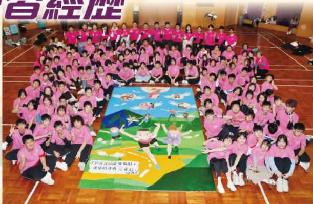
• 全體中一級學生合力完成壁畫，並展示於校園

為讓學生於六年的中學學習歷程中，能體驗多元的學習經歷，擴闊視野，學校特別調撥一星期的課時，舉辦多元學習周。不同級別的學生將參與不同的活動，以訓練其團隊協作、領袖才能、自律守規、探究精神等多方面的能力。更有機會走到香港以外的不同地方，擴闊眼界，增廣見聞。