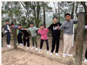
• 中一正向教育營，學生都勇於挑戰自我

正向教育營旨在培養學生正向思維，凡事學會以正面方式作思考，亦讓他們學會尊重別人，常懷感恩，懂得惜福。