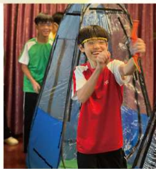
● 試後班本競技日，學生樂在其中