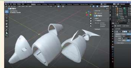
• 學生比賽作品(仿生機械人外觀設計)